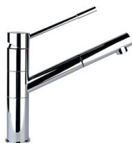
Miscelatore Lorenzo 8466 000