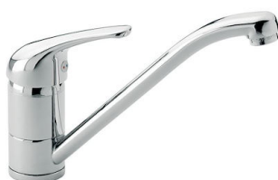
Miscelatore S1000 - RO 8443 002